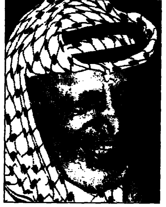
الرئيس الفلسطيني عرفات